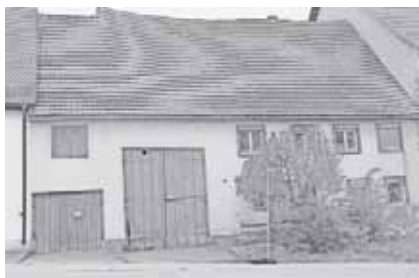
Stockacher Straße 7

Unter Tagesordnungspunkt „ Bekanntgaben “ teilte der Bürgermeister dem Gremium mit, dass das Gebäude Stockacher Straße 7 den Eigentümer gewechselt habe und demnächst abgerissen werden solle um einem Neubau Platz zu machen.