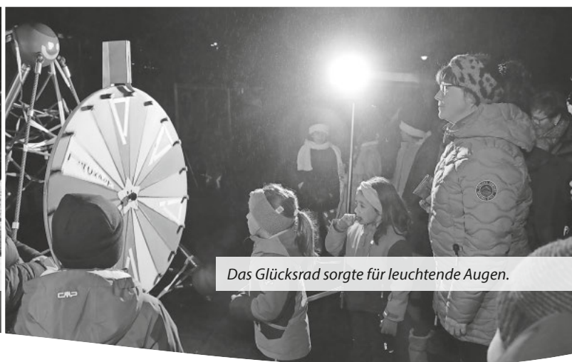
Das Glücksrad sorgte für leuchtende Augen.