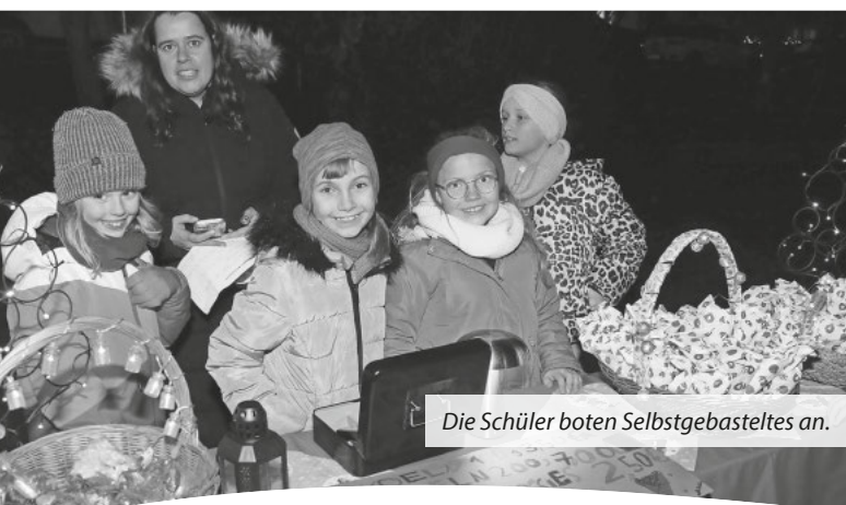
Die Schüler boten Selbstgebasteltes an.