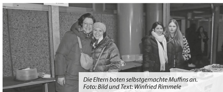
Die Eltern boten selbstgemachte Muffins an.

Und so endete der Weihnachtszauber mit glücklichen Kindern, zufriedenen Lehrkräften und Eltern.