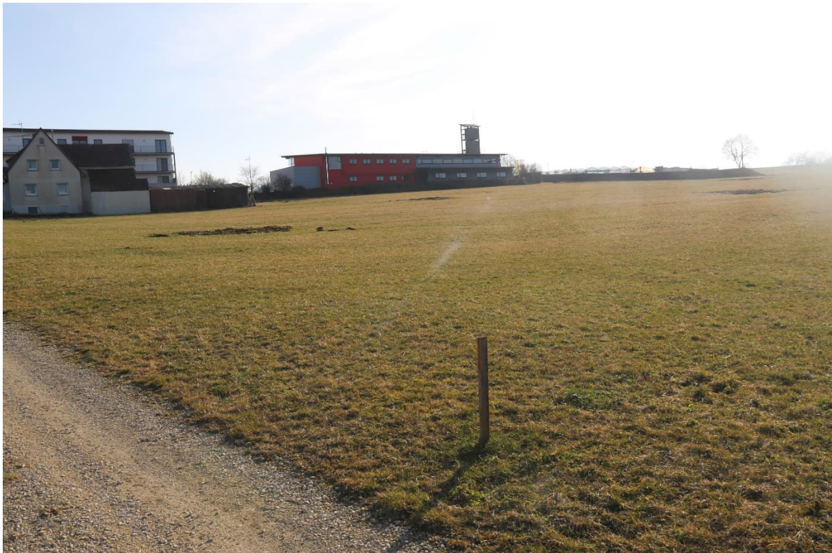
Abb. 2: Blick auf das Plangebiet von Nordosten nach Süden.