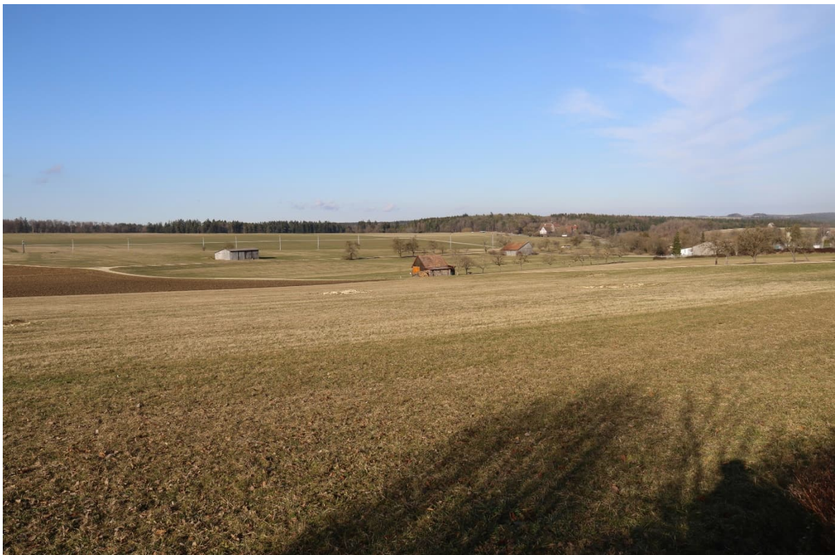
Abb. 3: Blick auf das Plangebiet von Süden nach Norden.