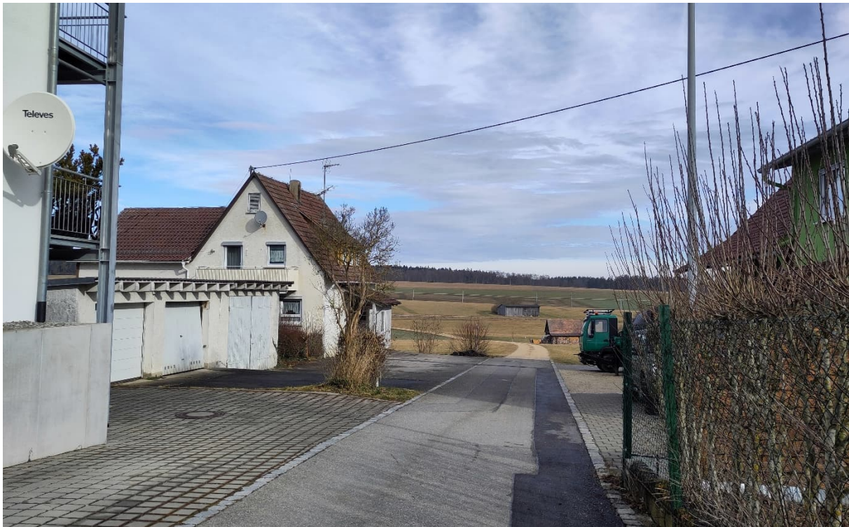
Abb. 4: Blick von Süden in die Nordstraße, die zur Erschließung dient