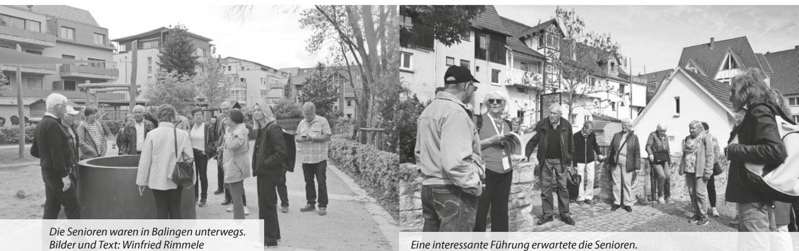
Die Senioren waren in Balingen unterwegs.

vor allem mit Hochwasser und einem Stadtbrand zu kämpfen, bei dem achtzig Prozent der Häuser den Flammen zum Opfer fielen. Durch diese Ereignisse änderte sich das Stadtbild grundlegend. Die Gerberei und Seilerei waren die Einnahmequellen der Stadt. So war noch die Reeperbahn als historisches Überbleibsel aus längst vergangenen Zeiten zu sehen. Bald wäre noch Balingen nach dem Fund von Schwefel im Wasser ein Bade- und Kurort geworden. Die evangelische Kirche war durch verschiedene Epochen wie Gotik und Barock geprägt und sorgte für Staunen. Nachdem der Wissensurst gestillt werden konnte, meldete sich nach fast zweistündiger Stadtführung der Magen. Im modernen Restaurant „Naboo“ konnte der Hunger und Durst gestillt werden. Frisch gestärkt und überwältigt von den vielen Eindrücken traten die Senioren die Heimreise an und, entgegen der Wettervorhersage, konnte der Schirm zu bleiben.