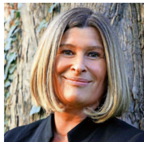
Autorin Petra Palumbo