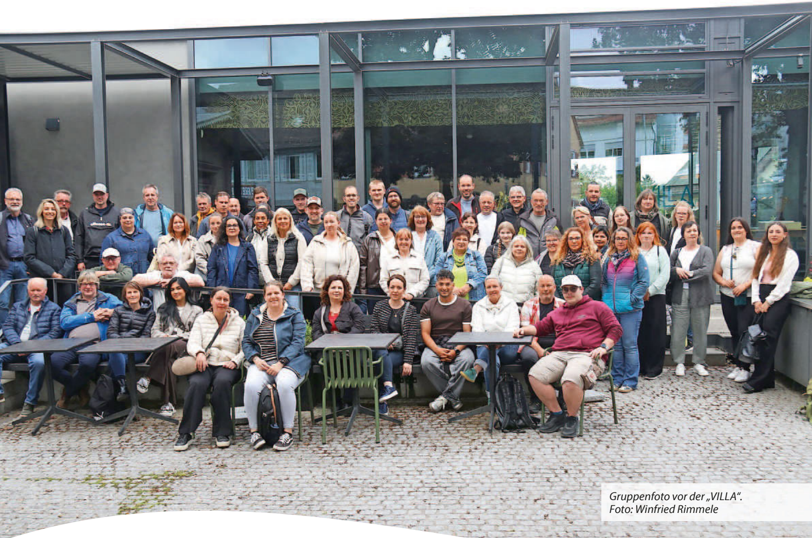
Gruppenfoto vor der „VILLA“.