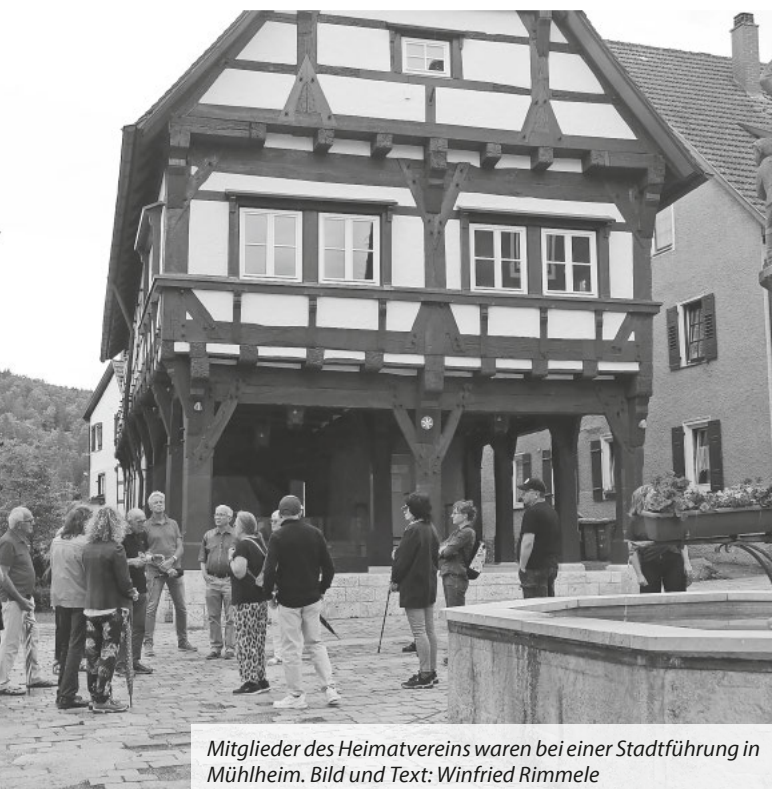
Mitglieder des Heimatvereins waren bei einer Stadtführung in Mühlheim. Bild und Text: Winfried Rimmel

Die Vorsitzende des Heimatvereins, Sibylle Schaz, dankte dem Stadtführer Ludwig Henzler für die rund 90 Minuten interessante Führung mit einem kleinen Geschenk und die Teilnehmer mit viel Beifall. Zum Abschluss des Nachmittags kehrten alle Teilnehmer noch im Gasthaus Adler in Neuhausen ob Eck ein, um sich bei Vesper und Eis zu stärken und die Eindrücke der Führung zu verarbeiten.