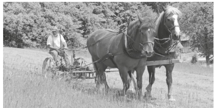
Landwirtschaft wie sie früher war. Bilder und Text: Winfried Rimmele